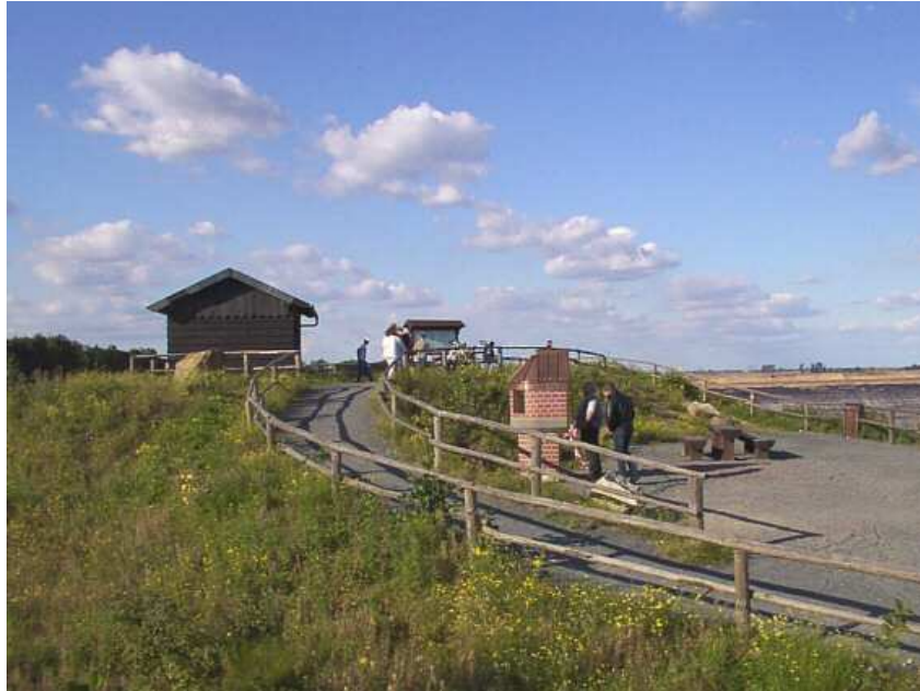
Aussichtspunkt Tagebau Garzweiler